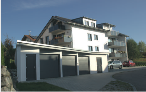
Acht moderne Eigentumswohnungen in Altusried