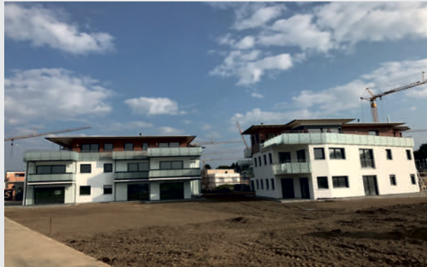
5 Mehrfamilienhäuser in Memmingerberg