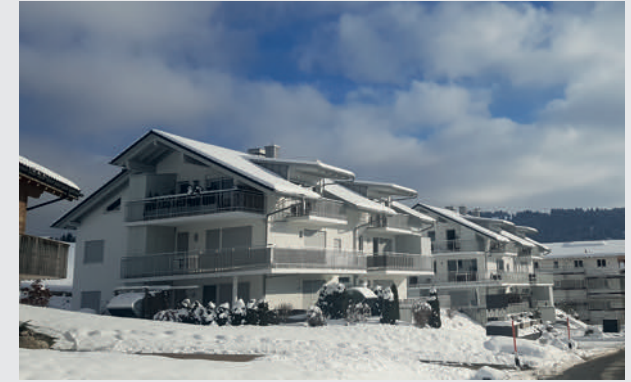
Zwei Mehrfamilienhäuser mit Ferienwohnungen in Oberstaufen