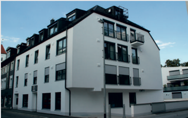
Zwei Mehrfamilienhäuser in zentraler Stadtlage von Kempten